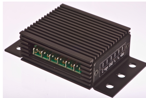
Abbildung 1 Anschlüsse des Reglers

Die Ladekontrollleuchte ist bei diesem Regler optional. Wenn das Motorrad keine Ladekontrollleuchte hat, lassen Sie einfach den C-Anschluss frei.