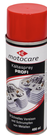
Motocare Kältespray Profi, 400 ml