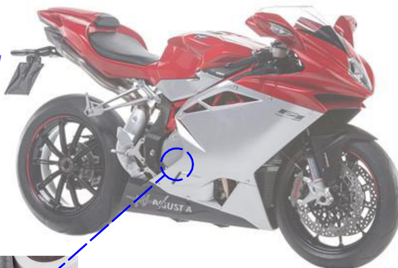
Immagine usata a fini esclusivamente illustrativi Image used for illustrative purposes only

Bloccare con frenafili: L= Leggera - M= Media - S= Forte Lock with the threadlocker: L= Light - M= Medium - S= Strong