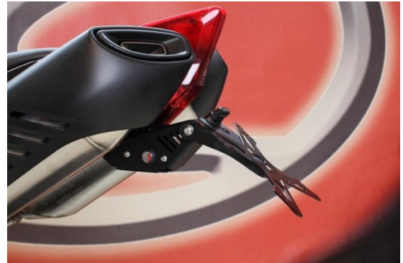
EVOTECH TAIL TIDY

Attenzione: Prima di procedere alla seguente descrizione di montaggio, Evotech specifica che declina all'utente le responsabilità dovute ad un non corretto montaggio dei prodotti e al loro utilizzo improprio. E' consigliato il montaggio del nostro kit da parte di personale specializzato.