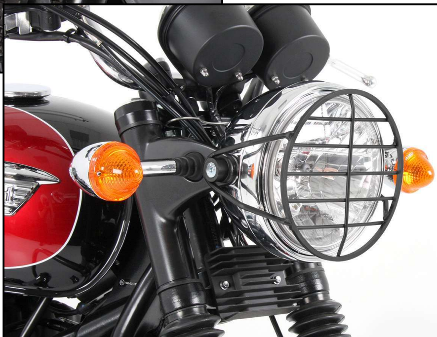
TRIUMPH Bonneville T100/SE

Weiteres Zubehör auf unsere Homepage. More accessories: see our homepage.