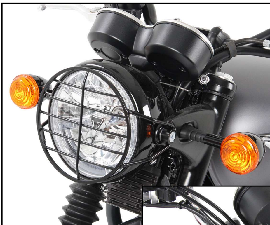
TRIUMPH Bonneville T 120