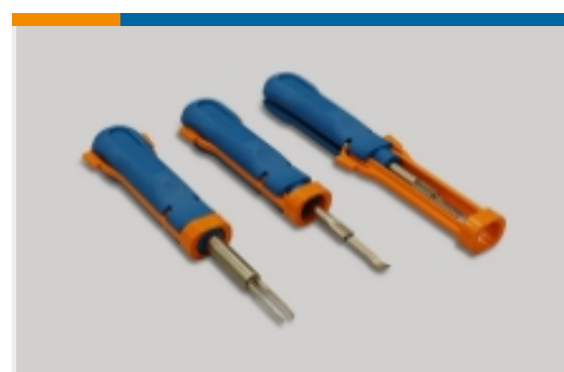
Einsetz- und Entriegelungswerkzeuge (4)