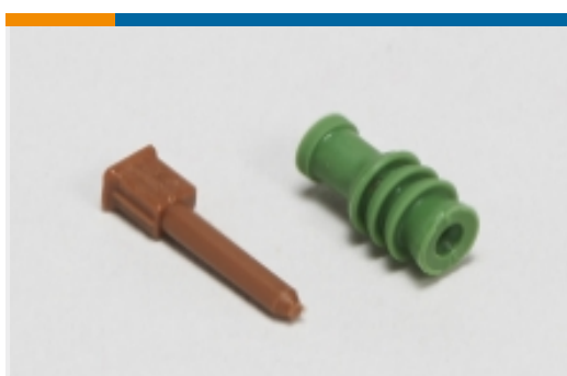
Dichtungen und Blindstopfen für Kraftfahrzeuge(4)