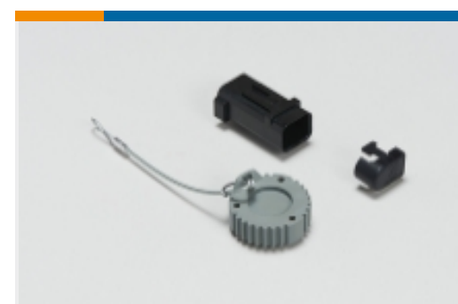
Kappen und Abdeckungen für Kraftfahrzeuge(2)