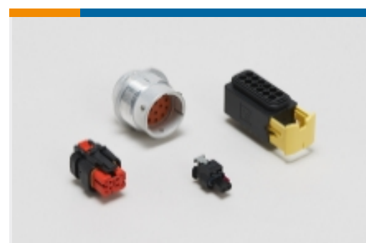
Gehäuse für Kraftfahrzeuge(26)