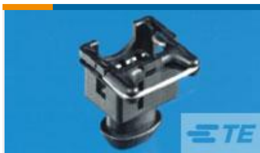
TE Teilnr.: 827551-3 JUNIOR TIMER CONNECTOR-HSG