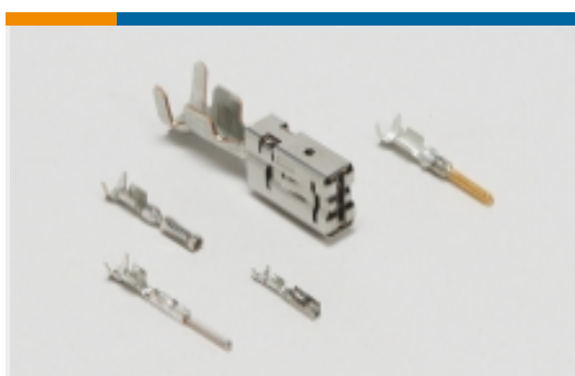
Kontakte für Kraftfahrzeuge(15)