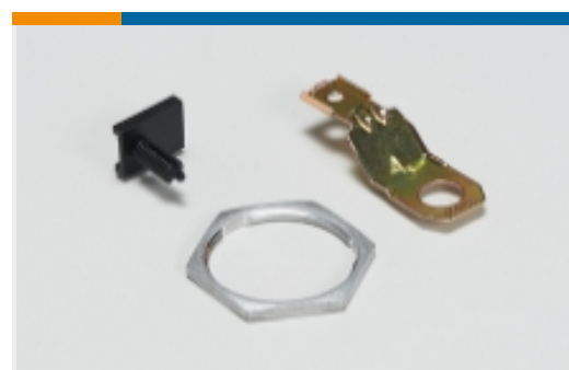
Weiteres Zubehör für Automobilsteckverbinder(2)